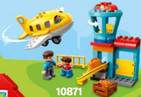
10871 Ages 2-5