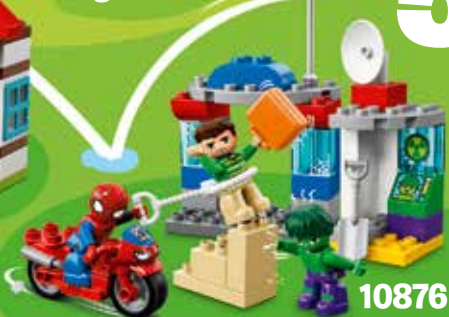
10876 Ages 2-5