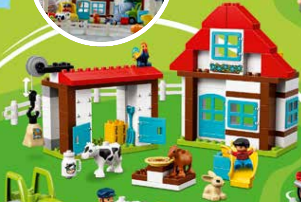
10869 Ages 2-5