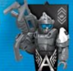
GENERAL MARCUS AURELIUS™