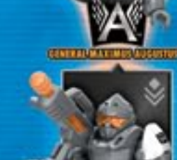
GENERAL MAXIMUS AUGUSTUS™